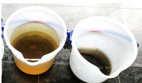
施工後の排水は こんなに汚い...